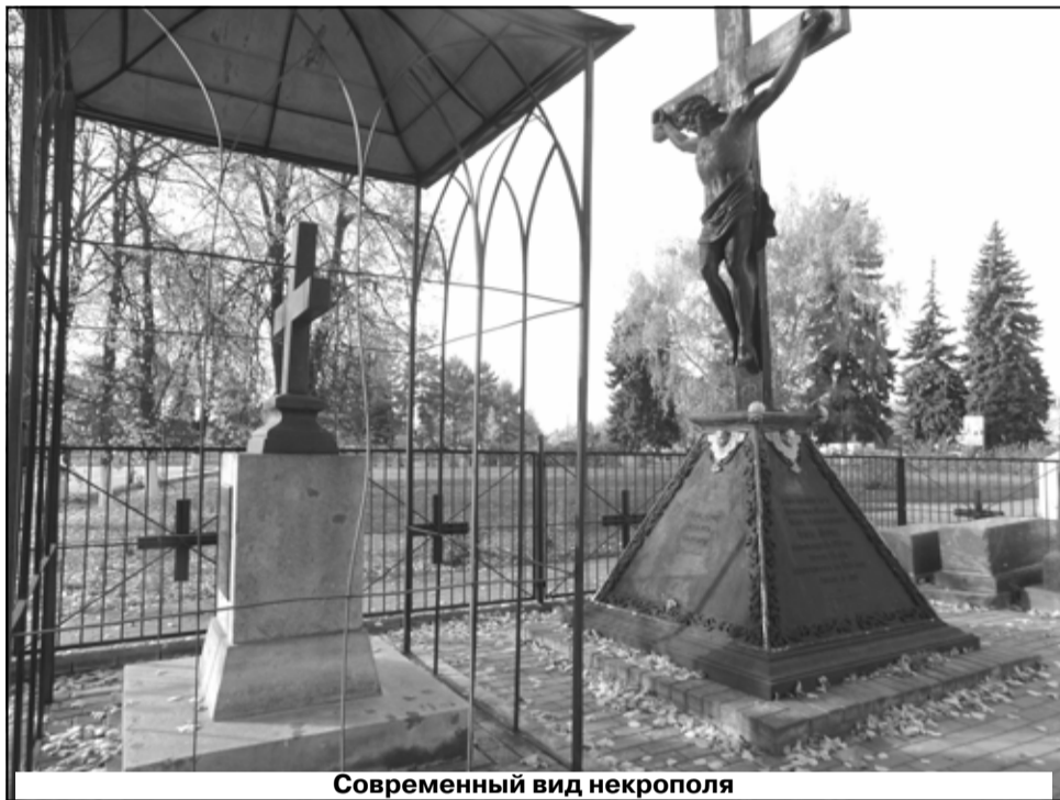
Современный вид некрополя

Рядом с братьями Фонвизиными в 1859 году был похоронен ещё один декабрист – Иван Иванович Пуштин (1798 – 1859) гг, лицейский друг А. С. Пушкина. После учёбы в лицее он служил в лейб-гвардии конной артиллерии, а в 1823 году поступил в Московский надворный суд на