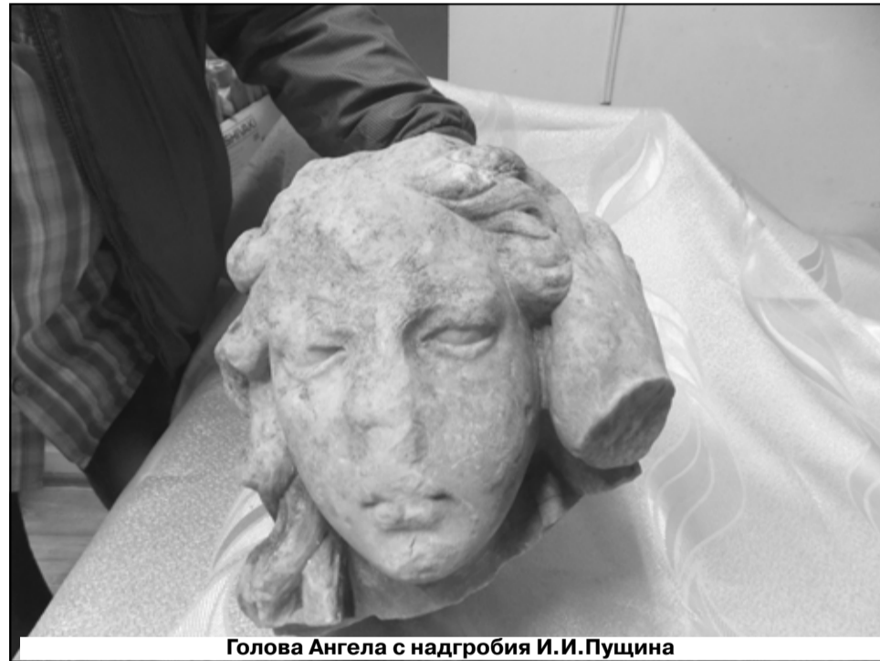
Голова Ангела с надгробия И.И. Пущина

До 1917 года памятникам на могилах братьев Фонвизинных и И.И. Пущина ничего не угрожало. Но, как известно, после революции началось повсеместно уничтожение церквей и кладбищ. Нависла угроза и над некрополем у собора Михаила Архангела в г. Бронницы. Об этом свидетельствует сохранившийся протокол заседания секции Народного образования Бронницкого горсовета за 13 мая 1927 года: «Слушали: «Об охране памятников декабристов Фонвизина и Пущина на кладбище при Соборной церкви». Постановили: «Просить Президиум Горсовета оказать содействие через церковную общину в охране памятников». Если появился такой документ, значит были какие-то негативные явления или разговоры по поводу некрополя. Кроме того, в 1927 году отмечали 90-летие А.С. Пушкина. А И.И. Пущин был лицейским другом поэта. Может быть, поэтому местные власти и обратили внимание на состояние некрополя.