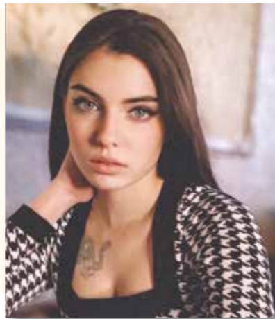
Над материалом работали Мария ЧЕРНЫШОВА и МЦ «Алиби»

Анна с помощью фотографии старается запечатлеть как можно больше неуловимых моментов окружающей жизни. Она увлечено фотографирует, обрабатывает получившиеся снимки в Photoshop и изучает теорию фотографии.