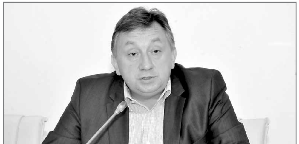
Олег ЖЛОБОВ, председатель Комитета по делам молодежи и спорта Московской областной Думы:

Среди новшеств выделил для себя внедрение в работу системы проектного офиса, основанного на тесном взаимодействии муниципалитетов с региональными ведомствами и министерствами по решению конкретных задач и реализации отдельных полномочий.