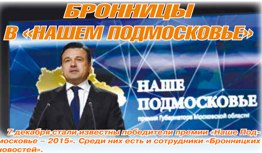
7 декабря стали известны победители премии «Наше Подмосковье – 2015». Среди них есть и сотрудники «Бронницких новостей».

Премия «Наше Подмосковье» была учреждена в 2013 году губернатором Московской области Андреем Воробьевым с целью поддержки социальных инициатив жителей региона. За 2 года проведения конкурса на соискание премии были поданы более 20 000 проектов. Популярность конкурса растёт – в этом году заявок подали в два раза больше, чем в прошлом – всего 24 тысячи.