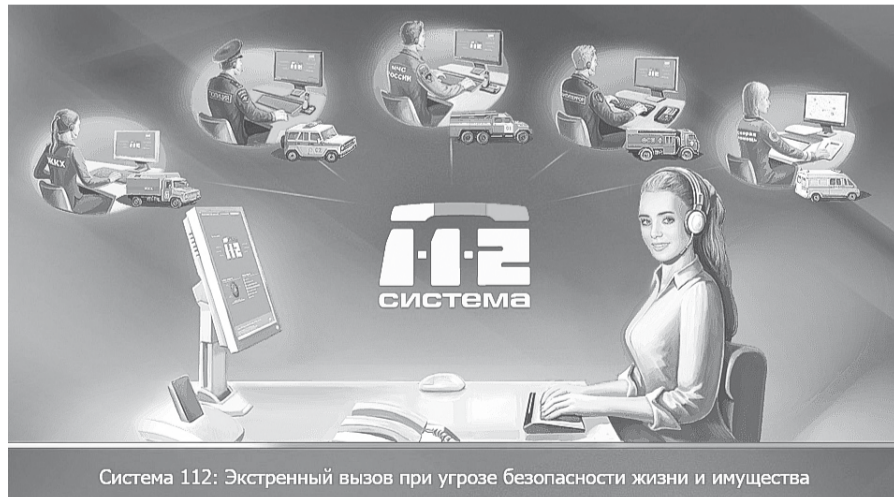
Система 112: Экстренный вызов при угрозе безопасности жизни и имущества

– В настоящее время уже 60% всех подмосковных экстренных вызовов попадает именно на номер «112». Ежедневно в систему-112 Московской области поступает более 20 тысячи вызовов. Ее внедрение уже принесло ощутимый положительный эффект. Особенно это