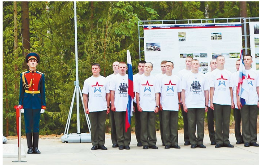
Будущие защитники Родины в парке "Патриот" смогут прыгнуть с парашютом, пострелять из боевого оружия, полетать и поездить на военной технике

– В преддверии Дня России мы заложили символический камень в строительство парка культуры и отдыха Вооруженных сил Российской Федерации. Свое название "Патриот" он получил не случайно. Здесь все будет пронизано патриотизмом и гордостью за нашу Родину. Любой желающий сможет прыгнуть с парашютом, пострелять из боевого оружия, полетать и поездить на военной технике. Важно отметить, что парк создается не в чистом поле и не с нуля. Для размещения запланированных объектов будет задействована существующая военная инфраструктура. В настоящее время все организационные вопросы практически решены, и мы приступаем к строительным работам.