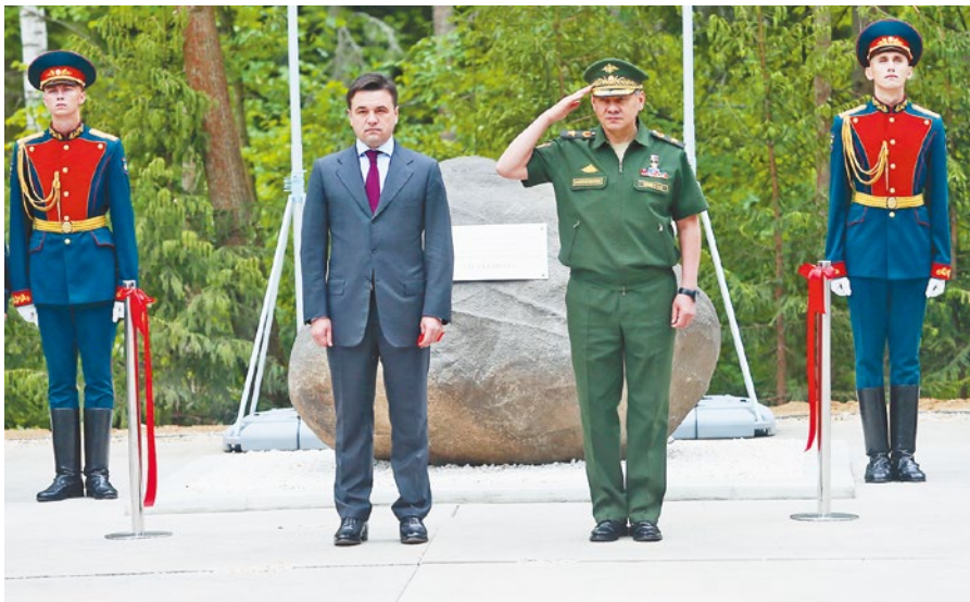
Губернатор Московской области Андрей Воробьев и министр обороны Российской Федерации Сергей Шойгу на церемонии закладки парка "Патриот"

Губернатор Московской области Андрей Воробьев и министр обороны Российской Федерации Сергей Шойгу заложили памятный камень на месте строительства военно-патриотического парка культуры и отдыха Вооруженных сил Российской Федерации "Патриот". Крупнейший в стране парк, который предоставит все условия для насыщенного и познавательного отдыха, расположится недалеко от поселка Кубинка, на 58-м километре Минского шоссе.