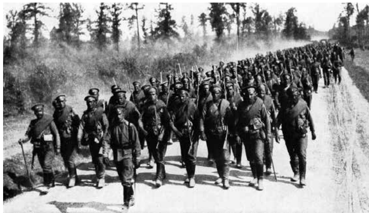
Русская армия на марше

вые боевые донесения о действиях наших войск: “К шести часам вечера 11 августа на всём фронте противник продолжает отступать на запад, оставив без боя 10-го вечером Инстенбург и Ангенбург; у последнего найдено три сильно укрепленные линии; при отходе немцы бросают винтовки, патроны, снаряды, снаряжение. По показаниям жителей, отступление идёт в главном на Инстенбург, Кенигсберг, Растенбург ..”.