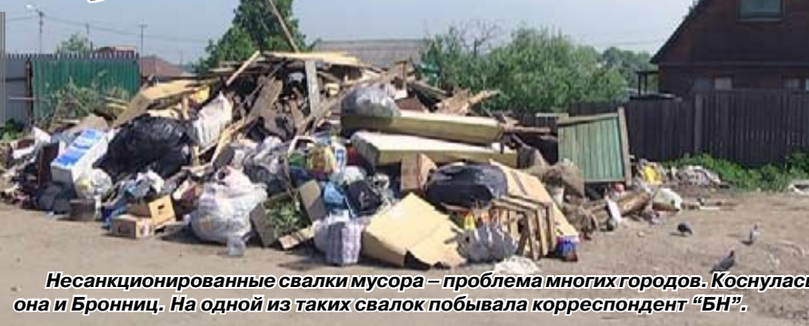
Несанкционированные свалки мусора – проблема многих городов. Коснулась она и Бронниц. На одной из таких свалок побывала корреспондент «БН».

Казалось бы, в центре города редко встретишь скопище мусора – ведь множество людей по долгу службы следят за состоянием улиц и площадей. Каково же было наше удивление, когда в исторической части города, а точнее в Пожарном проезде, рядом с площадкой для сбора мусора, мы увидели огромную свалку высотой около 2 метров со строительным и прочим мусором, которого здесь не должно быть. Такая же история со свалкой и в микрорайоне «Совхоз». Разбирают сараи, старые дома и везут сюда мусор не только горожане, живущие в частном секторе, но и жители близлежащих деревень.