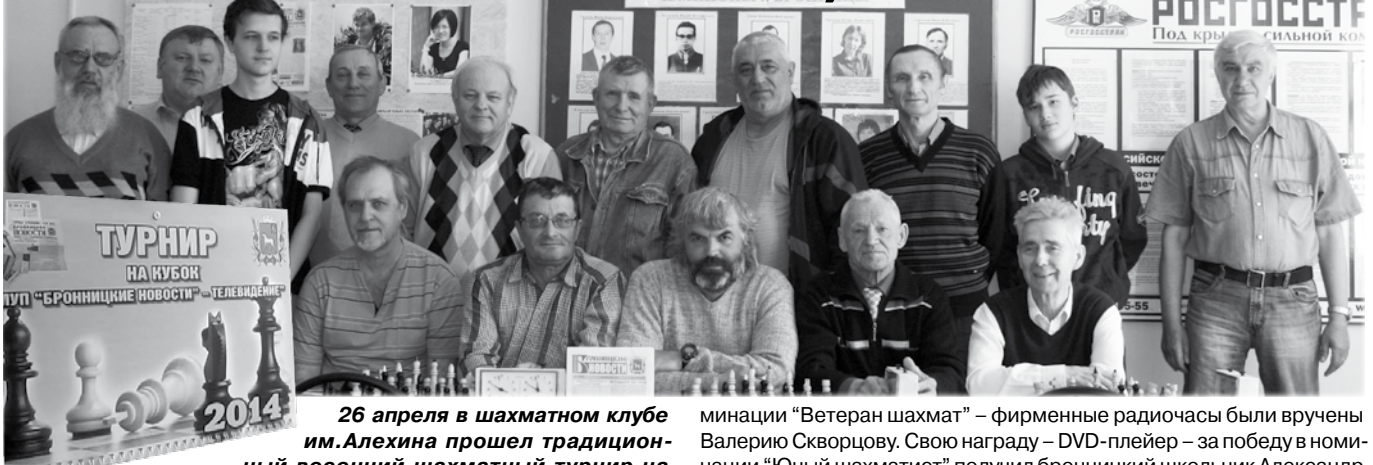
26 апреля в шахматном клубе им.Алехина прошел традиционный весенний шахматный турнир на кубок и призы МУП "Бронницкие новости"-телевидение".

Это уже пятый турнир городских шахматистов на призы "БНТВ". В этот раз в клетчатых баталиях приняли участие 16 самых известных в Бронницах шахматистов. Возрастной диапазон участников "клетчатых" баталий и в этот раз был как никогда широк – от школьного до пенсионного. Турнирные встречи проходили по уже отлаженной в клубе швейцарской системе. Было сыграно 9 туров, и все прибывшие на кубковый турнир шахматисты показали высокий класс игры и настоящий бойцовский характер. А многие сыгранные партии, по оценкам участников, были по-настоящему интересными, отличались неожиданными ходами и комбинациями.