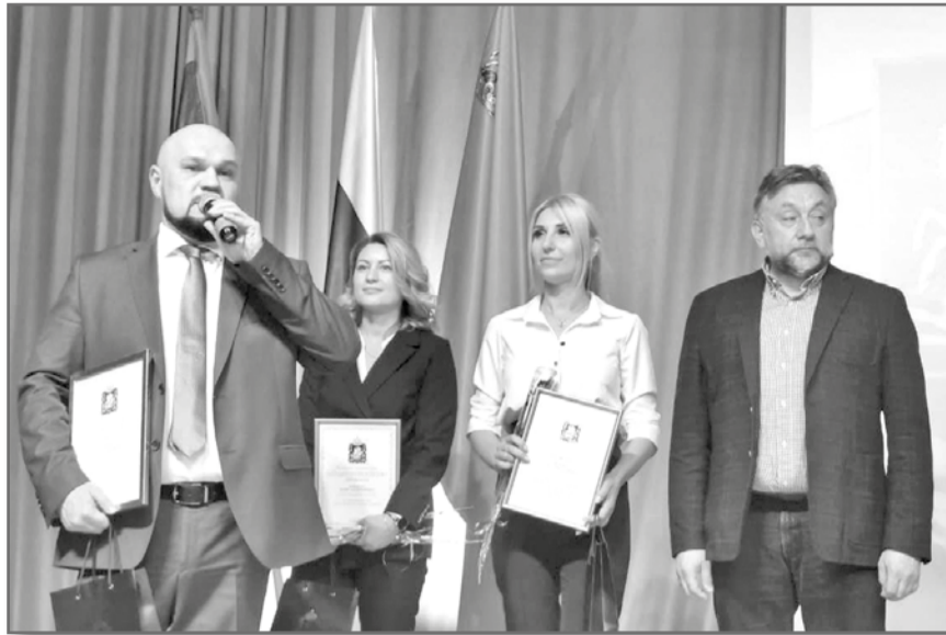
Начало 1 стр.

Праздник труда – это торжество, посвященное людям, достойно выполняющим свою работу. Это низкий поклон нашим передовикам, наставникам, ветеранам, передающим свой опыт и знания, помогающим молодому поколению определиться с правильным выбором профессии и главной цели в жизни. Именно благодаря повседневному кропотливому труду каждого жителя Бронницы развиваются, формируются достижения всего Подмосковья.