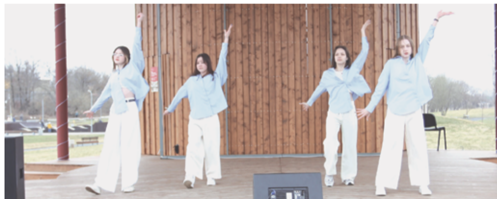
(Окончание. Начало на 1 стр)

Невозможно представить окружающую природу без наших крылатых друзей, всюду порхающих и снующих. Именно они первыми встречают весну своим радостным пением и щебетанием. Ежегодно, 1 апреля, в Бронницах, как и в других подмосковных городах, отмечается Всемирный день птиц.