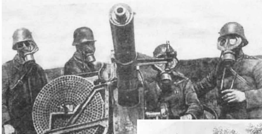
Газовые атаки стали самым страшным нововведением Первой мировой