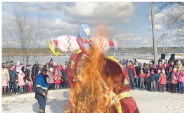
13 марта бронничане проводили зиму и встретили весну на традиционном городском празднике Масленицы.

Масленичная неделя в Бронницах завершилась большими народными гуляньями. На празднике побывали более трех тысяч человек. К 12 часам в воскресенье у эстрады озера Бельское собралось множество горожан. Люди приходили целыми семьями, как и повелось исстари – праздник Масленицы традиционно семейный.