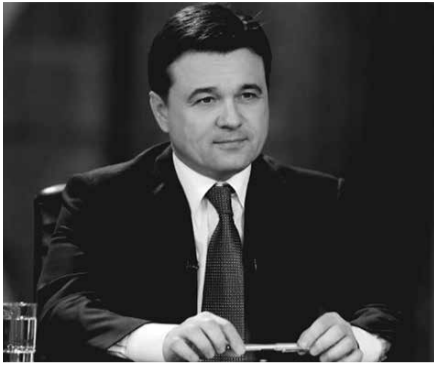
Губернатор Московской области Андрей Воробьев рассказал в интервью РИА Новости, какие сферы считаются приоритетными в регионе в 2016 году и как решаются проблемы обманутых дольщиков.