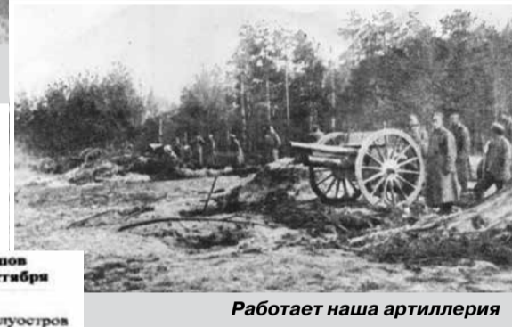
Работает наша артиллерия