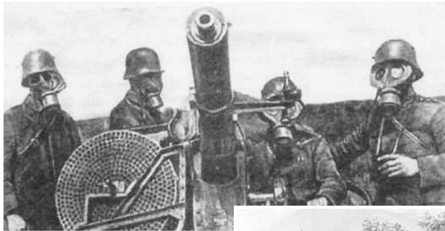
Газовые атаки стали самым страшным нововведением Первой мировой

211-го полка. Для отвлечения внимания противника была направлена разведка и полурота 6-й роты. Наступление было отбито, после чего разведка вернулась к себе. Расположение полка на 13-го октября не изменилось. Южнее озера Свентен стоят части 210 полка. Расположение рот с севера на юг: 13-я рота,