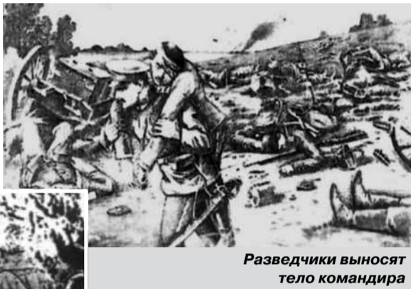
Разведчики выносят тело командира

22 сентября действовали разведчики в составе пяти человек. При отходе они были обстреляны. Разведчиками были обнаружены 2 трупа солдат 8-й роты, которые были принесены в наше расположение. При найденных находились одна винтовка и две лопаты. Двое разведчиков подползли к немецким