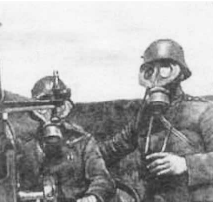
Работает наша артиллерия